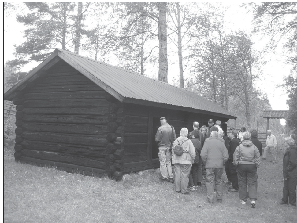
FINNSAM begrundar en loge vid hembygdsgården i Rämmen i juni 2007. Logen hade behandlats hel och hållen med "sletolja", vilket inte gillades av alla.