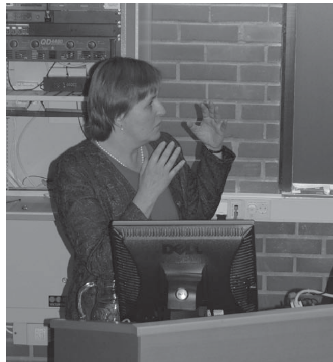
Doktoranden forsvarte sin avhandling godt.

historisk perspektiv og gikk mer i detalj. Med gode detaljspørsmål fra Tarkiainen og en svært fagsterk Wedin, fikk tilskuerne en interessant forestilling.